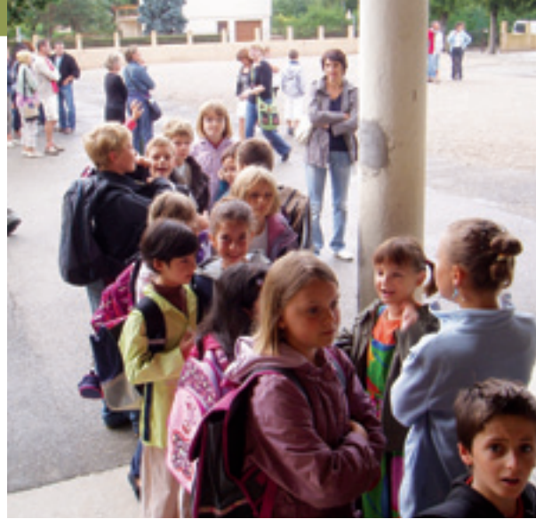
L'adaptation de la carte scolaire, en collaboration avec les communes environnantes, s'inscrit dans les perspectives 2012-2014.