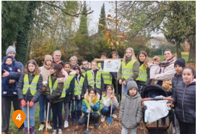
4 Une naissance, un arbre avec les CME et CMJ