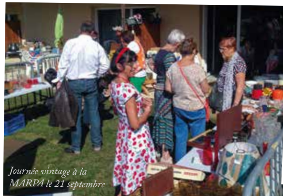
Journée vintage à la MARPA le 21 septembre