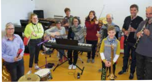
Le club Amitié rencontre a souhaité l'anniversaire à quinze de ses membres.