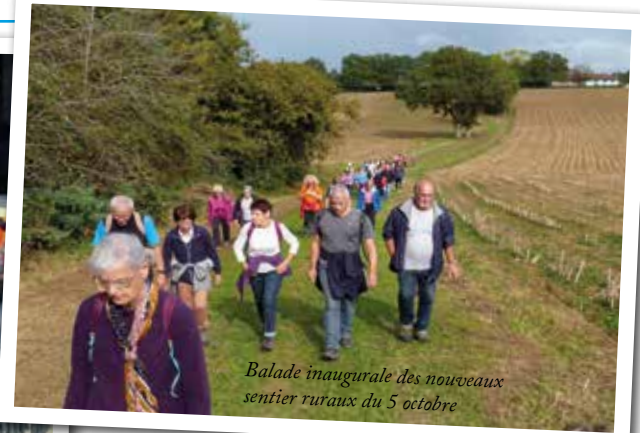
Balade inaugurale des nouveaux sentiers ruraux du 5 octobre