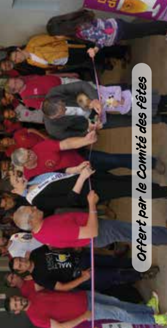
Offert par le Comité des fêtes