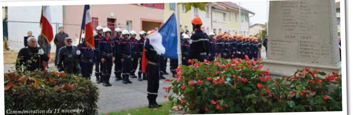
Commémoration du 11 novembre