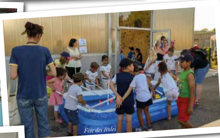
Fête des écoles