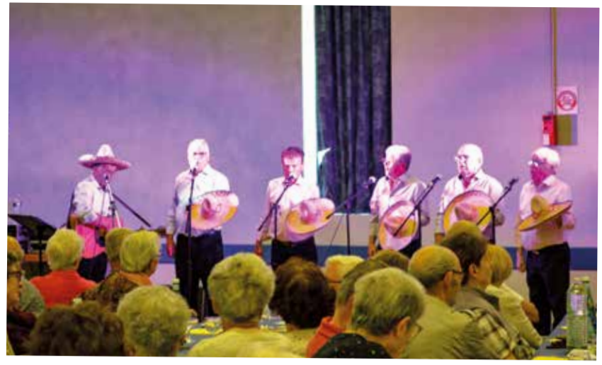
Après midi festif des anciens