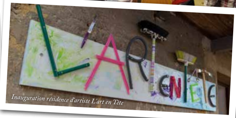
Inauguration résidence d'artiste L'art en Tête