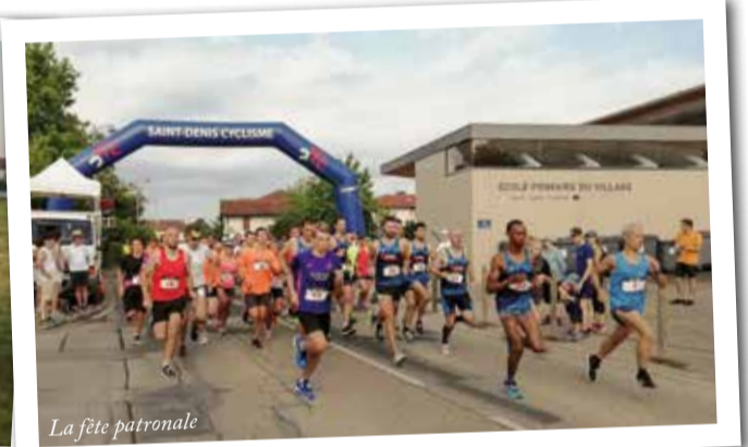
La fête patronale