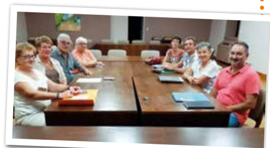
Comité de pilotage exposition Dionys'Artistes

Rendez-vous à la ferme du Pôle socioculturel.