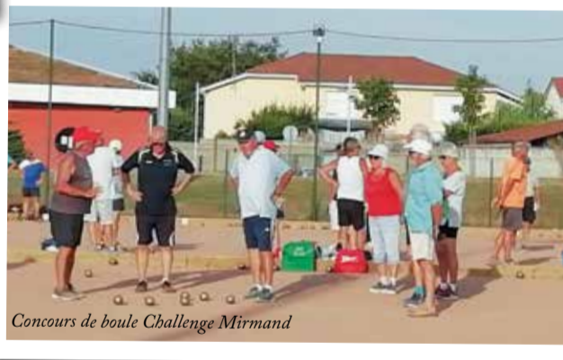
Concours de boules Challenge Mirmand