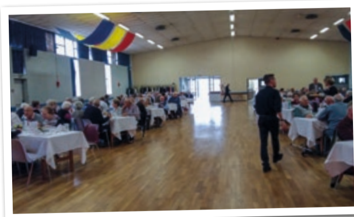
Le repas des anciens

Inauguration de l'aménagement des rues de la Charpine, Nungesser et Coli et de la pose de l'octroi.