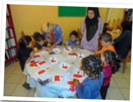
Confection de drapeaux français par les élèves des Vavres et les résidents de la MARPA