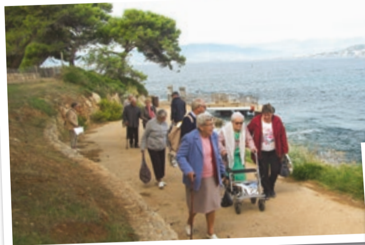
De beaux moments vécus par nos anciens fin septembre lors du voyage à Théoule-sur-Mer.

ASSOCIATIONS ACTION SOCIALE ET SOLIDARITÉ