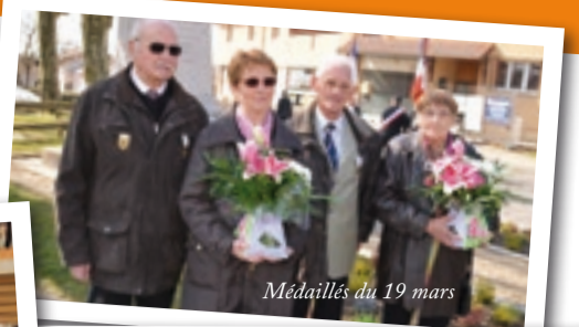
Médailles du 19 mars