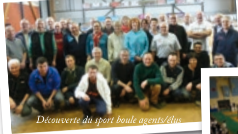
Découverte du sport boules agents/élus