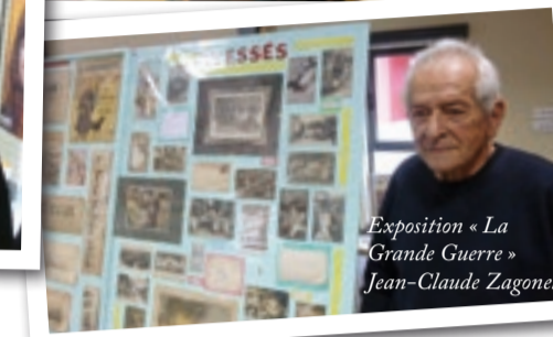
Exposition « La Grande Guerre » Jean-Claude Zagonel