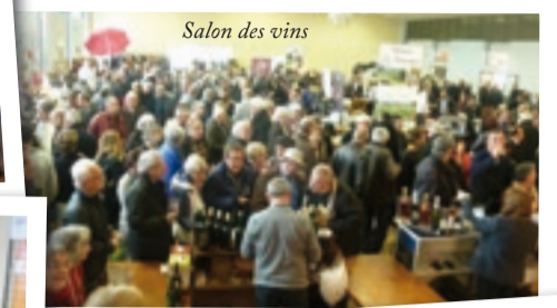
Salon des vins