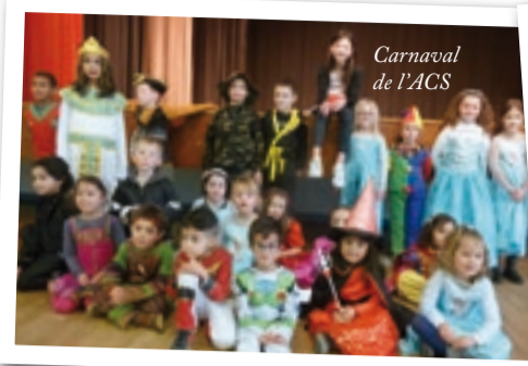
Carnaval de l'ACS