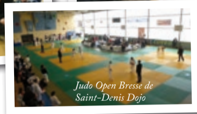
Judo Open Bresse de Saint-Denis Dojo