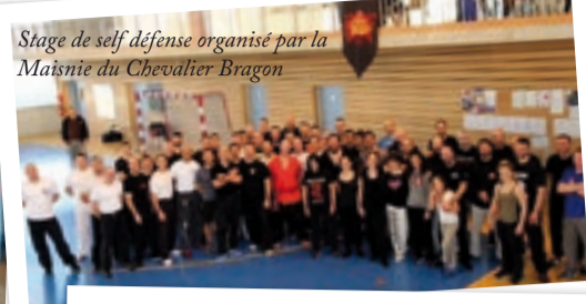
Stage de self défense organisé par la Maisnie du Chevalier Bragon