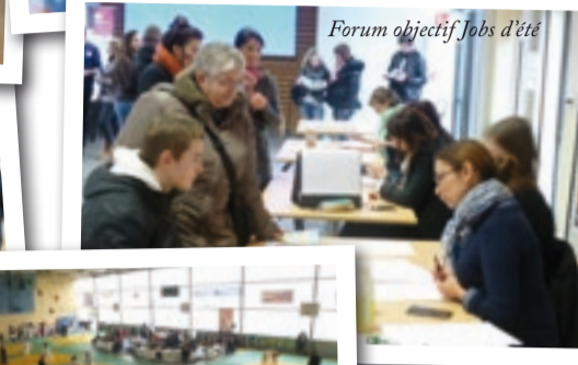
Forum objectif Jobs d'été