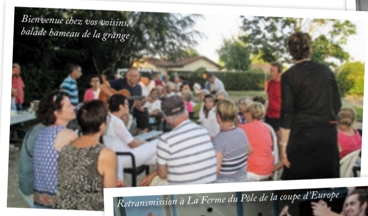
Bienvenue chez vos voisins, balade bateau de la grange