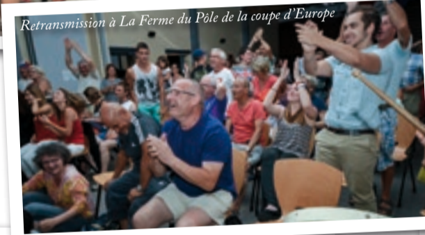
Retransmission à La Ferme du Pôle de la coupe d'Europe