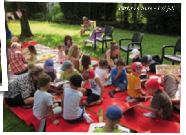
Partir en livre - Pré joli