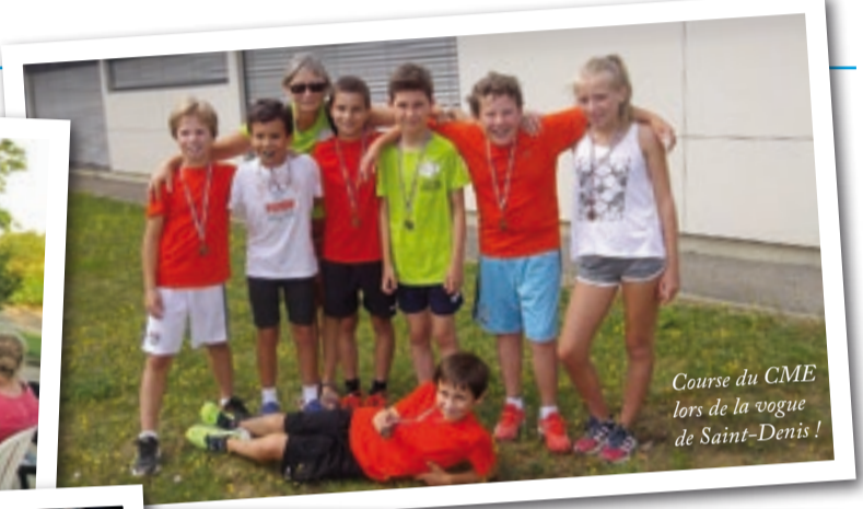
Course du CME lors de la vogue de Saint-Denis!