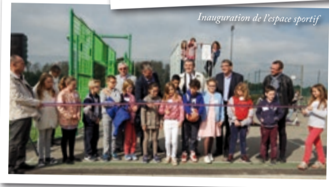
Inauguration de l'espace sportif