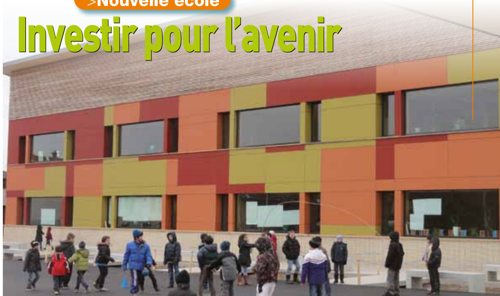
D'une surface utile de 2 000 m 2 , le nouveau bâtiment économe en énergie a conquis petits et grands.

Lundi 7 janvier 2013, les 255 élèves et l'équipe éducative ont investi la nouvelle école du Village.