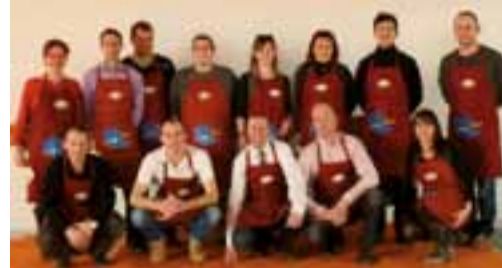
Une partie de l'équipe des 40 ans d'aujourd'hui, de service à l'apéritif au banquet 2012.

L'association La 13 e Vague, réunissant d'anciens et nouveaux Dyonisiens nés en 1973, prépare activement la fête des classes en 3 et en 8.