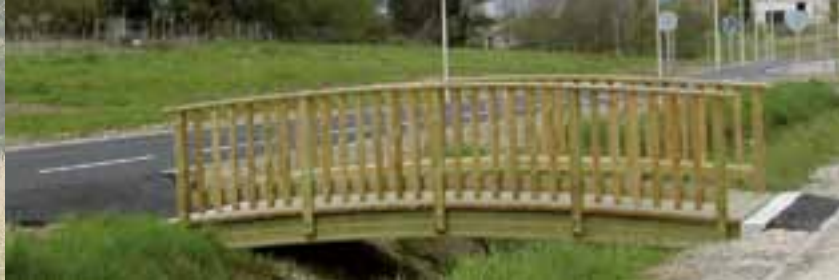
Les biefs de la Viole (photo ci-dessus), des Poches, de Richagnon, de la Richonnière et de Viocet traversent la commune.