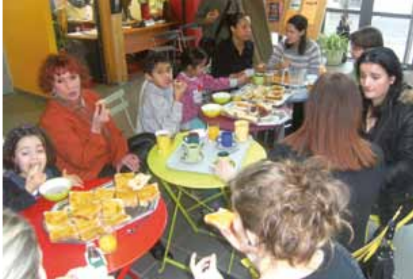
Atelier « Cuisinez en famille » spécial petit déjeuner.

1, place de la Mairie CS 30195 - SAINT DENIS LES BOURG 01005 BOURG EN BRESSE CEDEX Tél. 04 74 24 24 64 Fax 04 74 24 35 05 www.stdenislesbourg.fr mairie@stdenislesbourg.fr