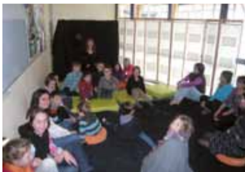
Nouveau : les rendez-vous « Contes en couleurs ».