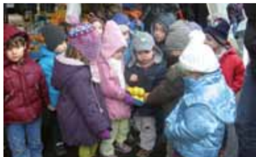
Au marché de Bourg un mercredi.