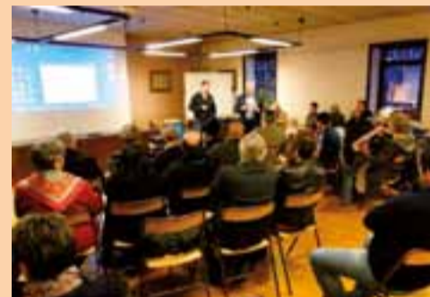
En réunion de quartier.

Le 4 décembre, la réunion de quartier organisée par la commune a réuni une trentaine de riverains de la rue de la Charpine, autour de trois points à améliorer : limiter la vitesse des véhicules, sécuriser les déplacements doux, éviter le stationnement sauvage.