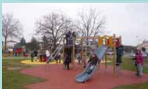
L'aire de jeux Lilas-Vavres.