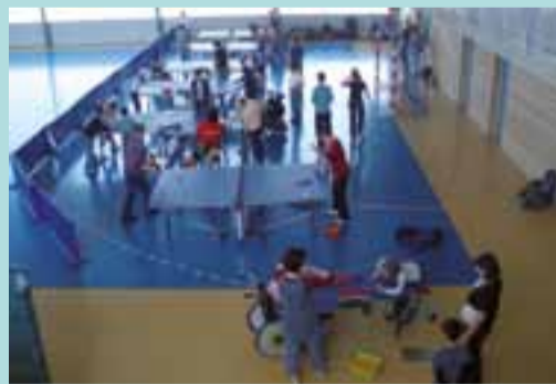
Les entraînements ont lieu les mardis, mercredis et vendredis soir, au gymnase.

Loisir ou compétition, débutants ou confirmés : le TTSD (Tennis de table de Saint-Denis) est un club ouvert à tous, y compris aux personnes handicapées. Le club compte cette saison 95 adhérents, de 7