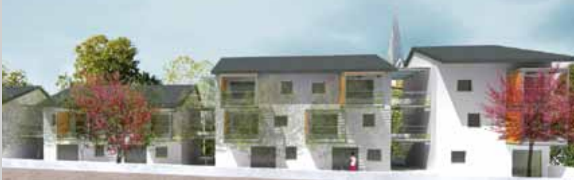
17 logements locatifs seront construits avenue de Trévoux à l'angle du chemin des Flèches.