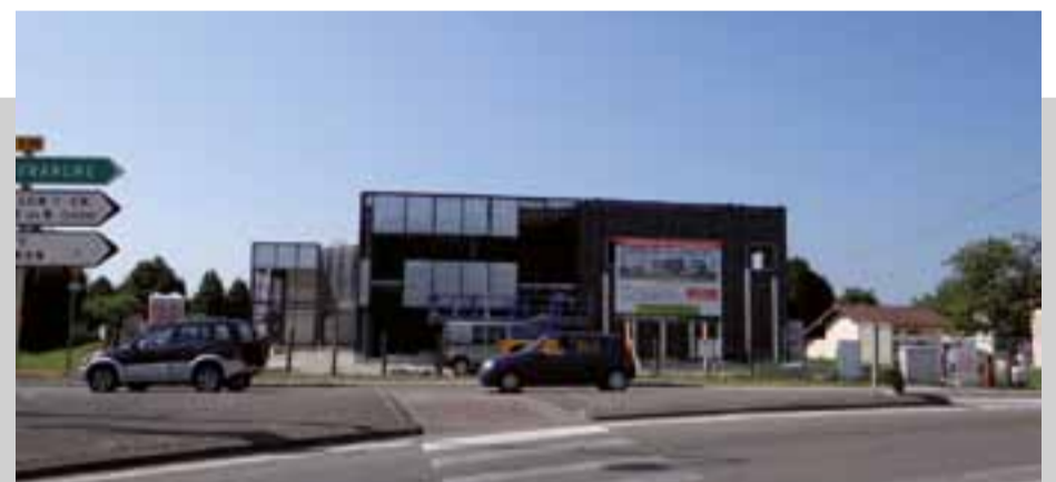
Bientôt, en face de la laiterie, ouvriront une boulangerie et un magasin de produits pour les animaux domestiques.