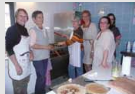
Les activités animées par les habitants ont repris, comme l'atelier Cuisine.

Enfin, le Café habitants et l'accès libre à Internet forment deux permanences du Pôle très prisées, en plus de celles du Point info emploi (PIE) ou du Point accueil solidarité (PAS) du Conseil général. « Nous sommes vraiment le lieu de portage d'initiatives et de créativité : expositions, ateliers... Nous aidons à la faisabilité de toute idée. » ●