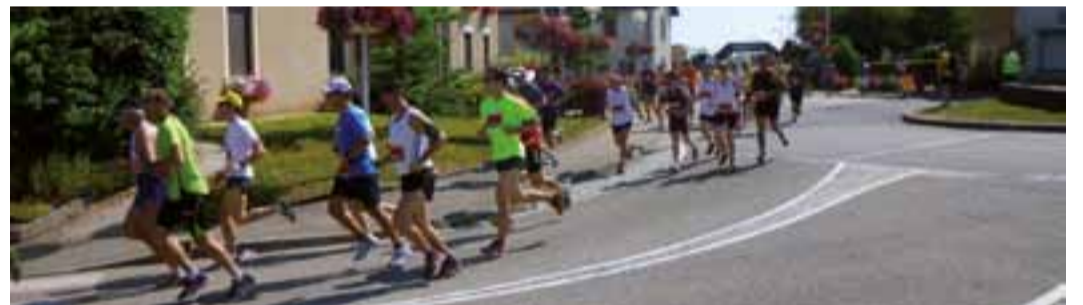
Les coureurs des Foulées dyonisiennes ont sillonné la commune, sur 5 ou 10 km.

Dimanche 21 juillet, 154 coureurs étaient au top départ des 1 res Foulées dyonisiennes organisées par Saint-Denis Rando Cyclo. « Il n'existait pas auparavant de course sur Saint-Denis dans le cadre du Challenge de Bourg-en-Bresse Agglomération. L'association a répondu oui pour l'organiser, une commission s'est créée, nous avons proposé au comité des fêtes de la faire pendant la fête patronale, tous les membres de Saint-Denis Rando Cyclo se sont vraiment