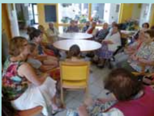
Les conseillers municipaux enfants ont rencontré les résidents de la Chênevière en juin.