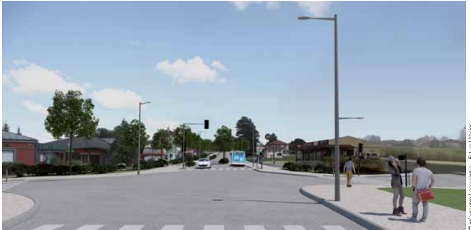
© infographie Lecarpentier - Futurs Urbains

Cet automne, plusieurs chantiers entrent en phase de réalisation, dont le projet de réaménagement de l'avenue