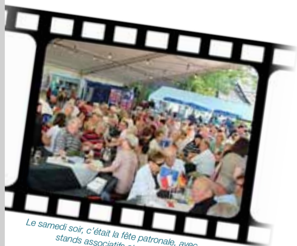
Le samedi soir, c'était la fête patronale, avec stands associatifs et convivial repas.

Saint-Denis. Nous sommes allés à Schutterwald pour la première fois, ma femme, moi et les deux enfants, en juin, pour le 25 e anniversaire. L'organisation était impeccable, tout était bien minuté. Nous avons été accueillis par une famille, qui nous a vraiment choyés. Le samedi soir, la fête du village, avec les associations locales, était très conviviale. Les enfants sont ravis, ils ont vu des habitudes de vie différentes.