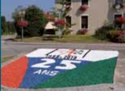
Le comité de fleurissement et les services techniques municipaux ont réalisé un symbolique parterre fleur.