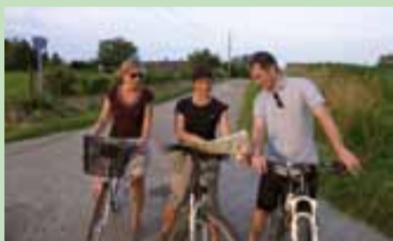
Les élus avaient effectué une reconnaissance du parcours en juillet.

Saint-Denis participe pour la troisième fois aux Florales internationales de Bourg-en-Bresse. Les services techniques municipaux, le comité de fleurissement et la commission Développement durable préparent activement le stand aux « couleurs tropicales » – thème 2013 – qui sera à découvrir du 8 au 17 novembre, à Ainterexpo. www.ainterexpo.com