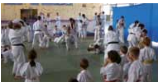
Démonstrations au gala d'anniversaire.

Fin juin, Saint-Denis Dojo a célébré son 10 e anniversaire, avec gala et gâteau. Réunissant 250 membres, il compte près d'une cinquantaine de ceintures noires. Il est le 2 e club de l'Ain au classement des médailles en championnat 2012/2013.