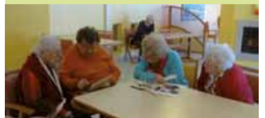
Les résidents préparent le projet.

Rendez-vous le 1 er décembre, à 15 h, à la salle des fêtes, pour découvrir ces « 100 ans de vie, 100 ans de mode ». Un siècle de tranches de vie, des années 1920... à 2020. ●