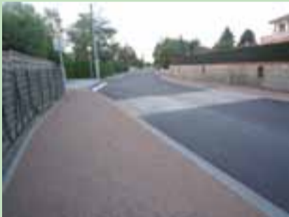
Chemin des Cadalles, les travaux d'assainissement sont en cours de finition.