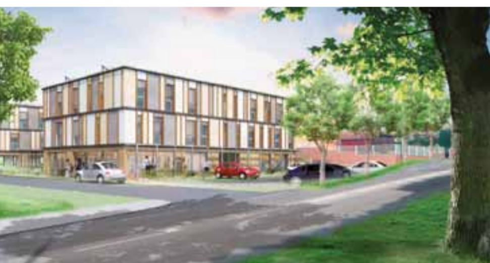
En bas de la rue de Shutterwald, le futur bâtiment commercial et de bureaux en cours de commercialisation.