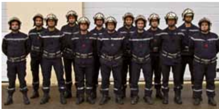
L'équipe des sapeurs-pompiers bénévoles du CPI de Saint-Denis.

Résider sur la commune, être âgé de 16 à 50 ans et avoir envie de rendre service : tels sont les simples critères pour intégrer le groupe de sapeurs-pompiers bénévoles de Saint-Denis. Les nouveaux sont les bienvenus. « Nous sommes une équipe de 14 volontaires, de tous âges, dont une femme. Nous effectuons plus d'une cen-