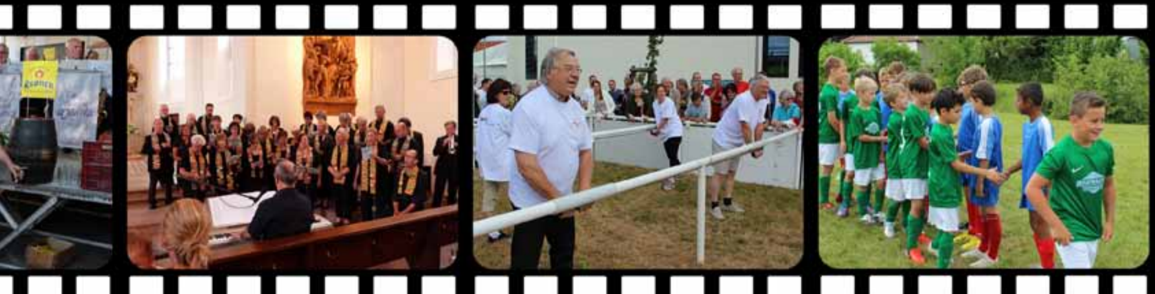
Le dimanche matin, les chants du Gospel Choir accompagnent la célébration œcuménique présidée par le pasteur et le curé de Schutterwald.