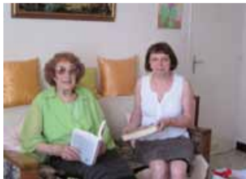
La bibliothécaire de Saint-Denis se déplace au domicile des lecteurs et lectrices ne pouvant se déplacer.

À noter aussi : le service de portage de livres à domicile mis en place par la médiathèque (voir page 8). ●