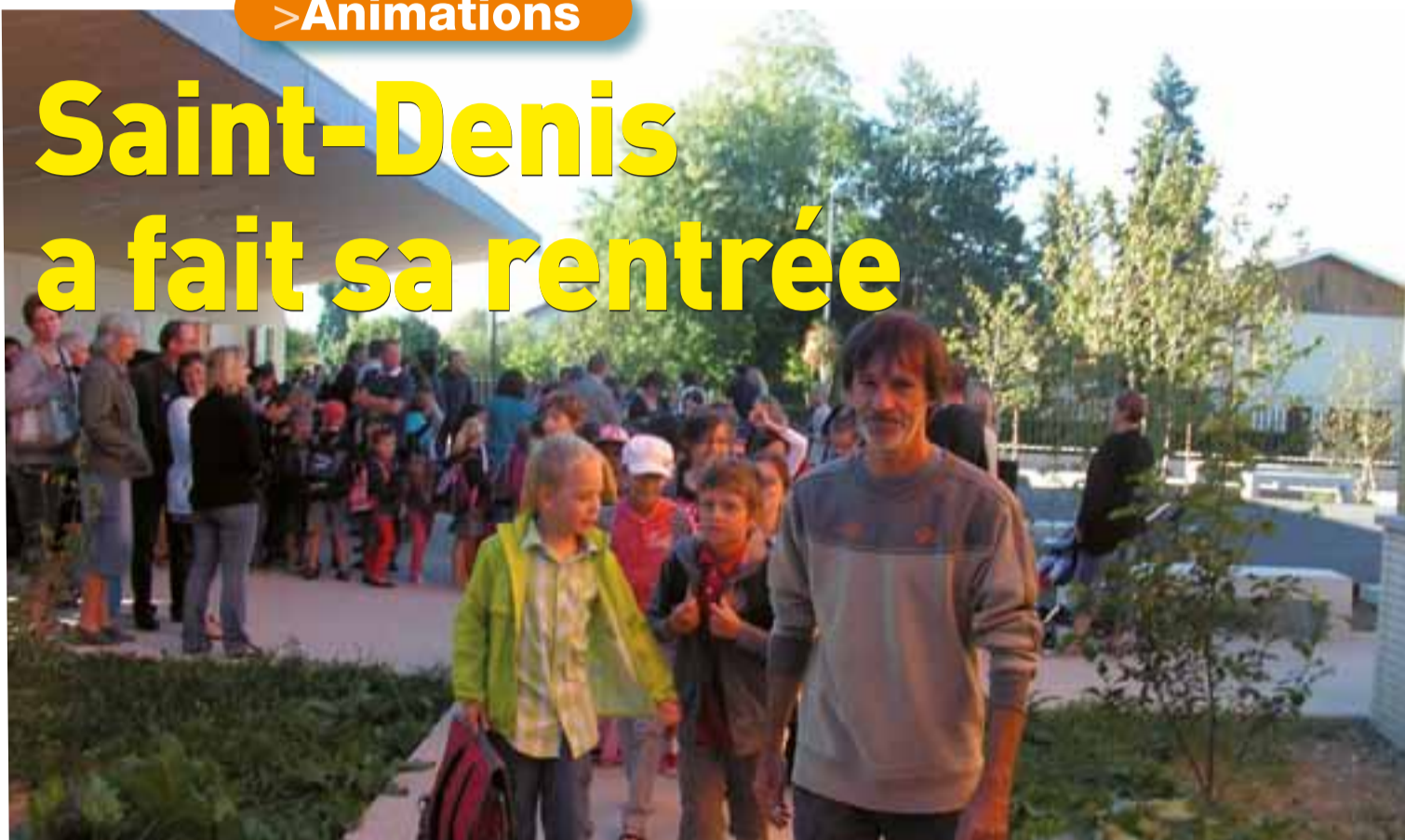
Dans le cadre de la réforme des rythmes scolaires, la nouvelle organisation se met en place.