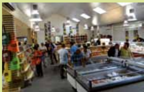
Au premier jour d'ouverture, les clients ont apprécié autant les produits que le contact avec les producteurs.

Ce 11 septembre, une quarantaine de clients font leurs achats dès la première heure d'ouverture de leur nouveau maga-