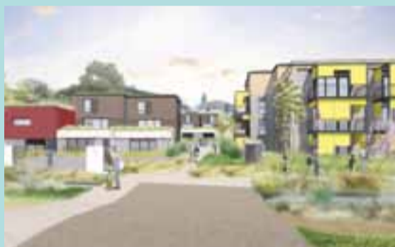
Toutes les façades Est des bâtiments donneront sur le parc.