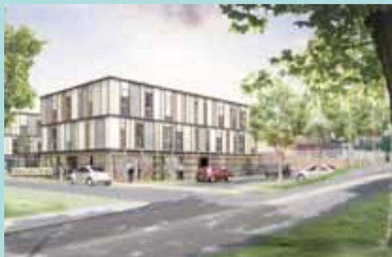
Le bâtiment de bureaux sera le premier livré en 2014.