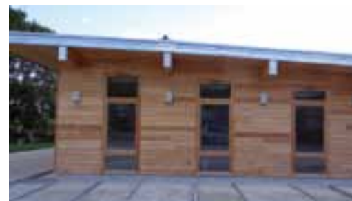
Un nouvel équipement pour les associations.

La construction d'une salle communale de 80 m 2 , à l'emplacement de l'ancienne salle paroissiale, s'est achevée cet été. Ouvert depuis fin septembre, le nouvel équipement est à disposition des associations pour une réunion ou une assemblée générale. Elles doivent pour cela s'adresser au pôle socioculturel. Une convention bipartite, signée par la commune et le pôle socioculturel, définit les modalités d'utilisation.