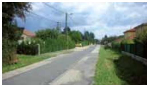
L'aménagement du chemin prévoit entre autres la création d'un espace pour les piétons et cyclistes.

Le 6 juin, la commune conviait les habitants du quartier des Lazaristes à une réunion d'information. Le bureau d'études Aintégra a présenté un projet d'aménagement axé sur deux objectifs : réduire la vitesse des véhicules et sécuriser les déplacements doux (piétons, vélos). Des réductions ponctuelles de largeur de la chaussée, additionnées d'obstacles (coussin berlinois), permettront de tempérer le flux de circulation, d'aug-