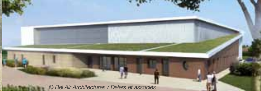
© Bel Air Architectures / Delers et associés