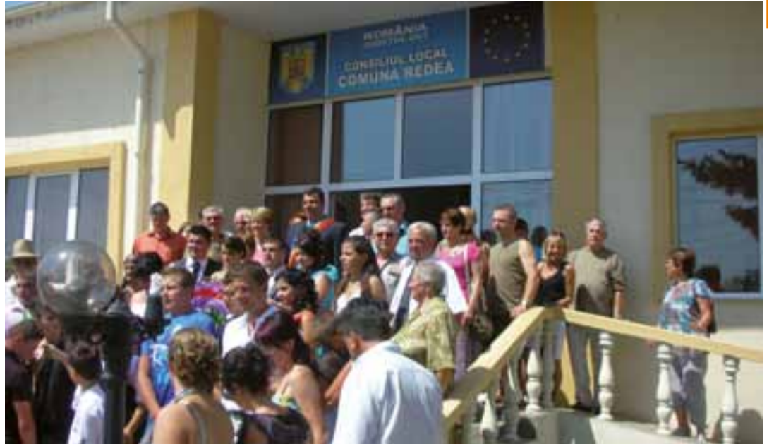
Devant la mairie de Redea.

Le comité de jumelage Saint-Denis / Redea a organisé un voyage en Roumanie, du 20 au 30 juillet, afin de rendre une visite d'amitié aux Roumains accueillis l'an dernier pour le 10 e anniversaire du jumelage et de mieux connaître ce pays au patrimoine remarquable. Les 27 participants, dont 15 venaient pour la première fois en Roumanie, ont d'abord séjourné trois jours chez l'habitant à Redea, avant de visiter la région des Carpates, le château de Dracula à Bran, le village-forteresse de Pejmer, le château royal de Peles, la mer Noire et le delta du Danube. Tous ont apprécié l'accueil chaleureux et la richesse des découvertes. De nouveaux liens d'amitié sont nés entre les habitants des deux communes. Le co-