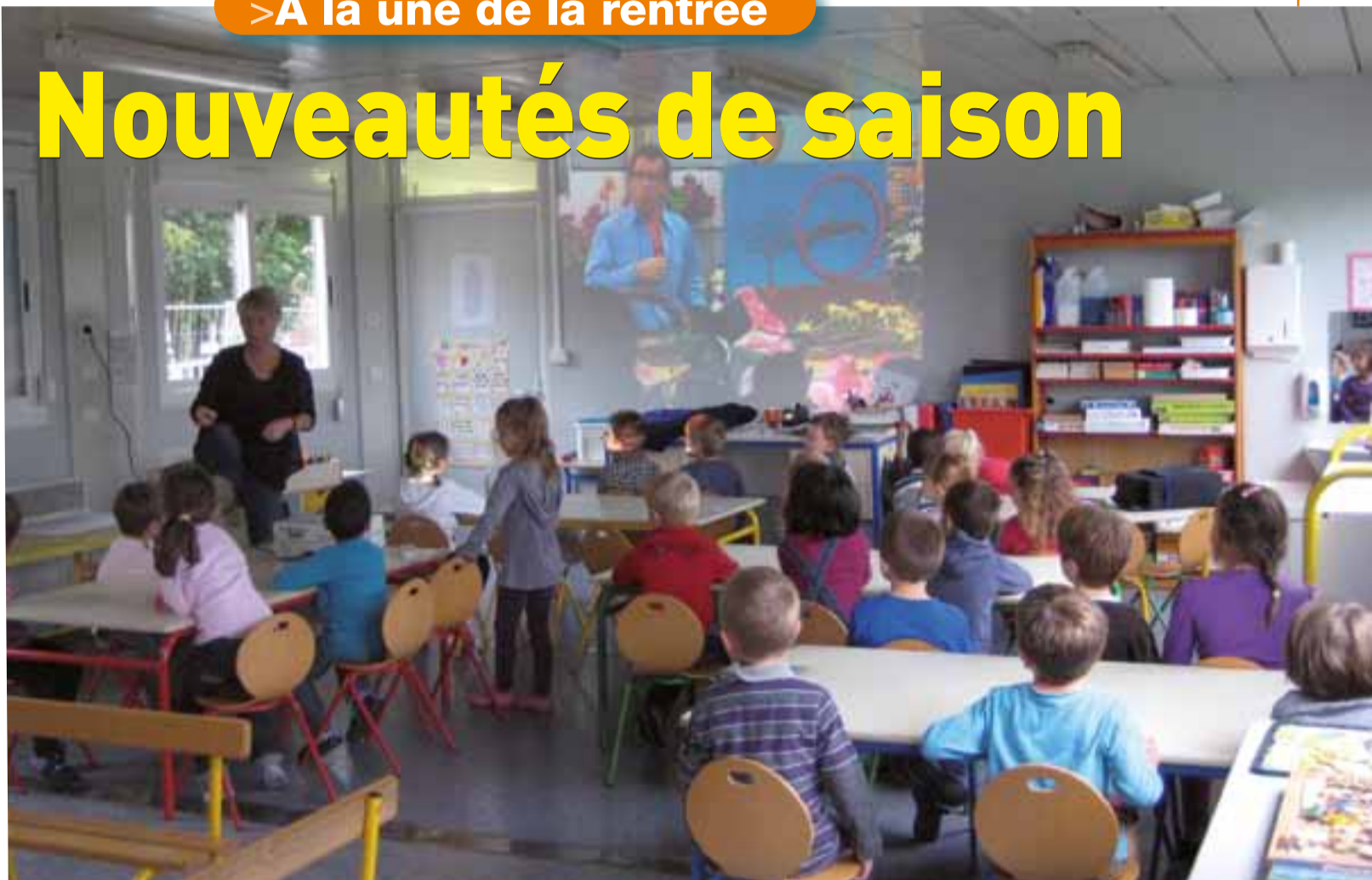
À l'école du Village.