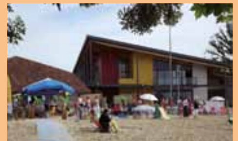
La Plage du pôle a joué les prolongations jusqu'au 19 juillet.

Ouvert à tous, gratuit, le vaste espace sablé et ombragé, aménagé sur le parc de la cure, avec transats, parasols, jeux de plage, coins pique-nique et animations diverses, a accueilli plus de 4 000 personnes, enfants et adultes, du 23 juin au 19 juillet. ●