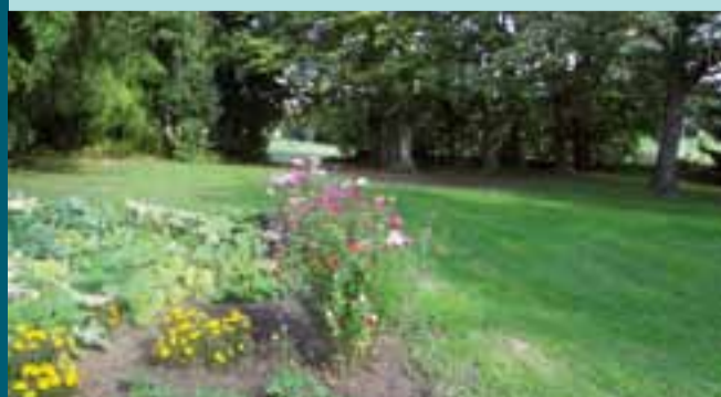
Le pré de la Cure.

« Il n'y a pas meilleur lien social que l'espace public, à condition d'y être à pied. »