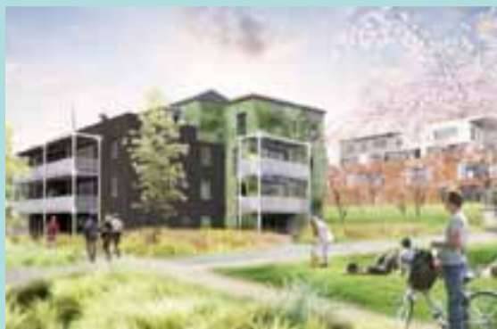
Les bâtiments ont un air de famille, sans être jumeaux.