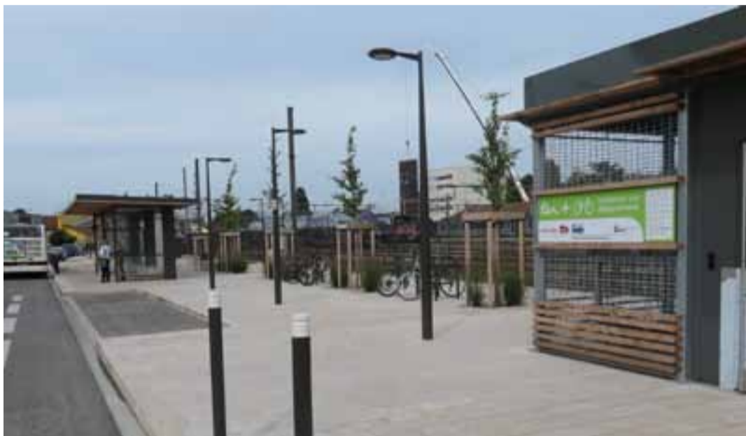
Le pôle d'échanges multimodal, côté Peloux.

Quant au terrain implanté sur la commune