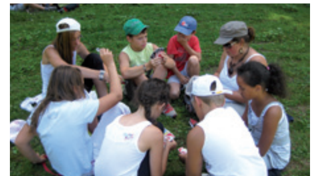
Au centre de loisirs de l'association Pyramide.