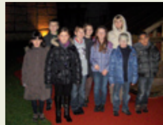
Le conseil municipal d'enfants 2011/2012.

À noter entre autres en 2012 : une rencontre des conseils municipaux d'enfants de l'agglomération de Bourg-en-Bresse à Saint-Denis et l'organisation d'un rallye piéton le 21 mars. ●