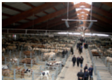
Le foirail de la Chambière, premier de France, est situé sur la commune de Saint-Denis.

À noter parmi les actions et projets concernant particulièrement la commune : le développement de la zone du Calidon, la création du point de vente directe Femandises, d'un boulodrome intercommunal à Saint-Denis, l'aménagement d'Ainterexpo, de la gare de Bourg, de pistes cyclables, la gestion du réseau de bus, le Plan climat énergie, la collecte des déchets ménagers, l'équipement de terrains pour les gens du voyage, le foirail de la Chambière, les Points info emploi... ●