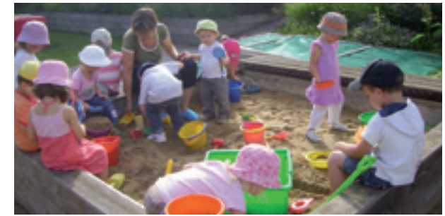
Au pôle petite enfance Bout'chou.