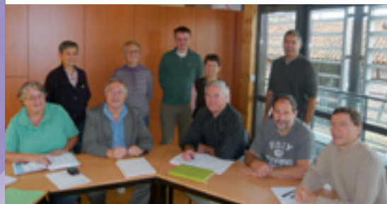
Élus municipaux et dirigeants du centre social se réunissent régulièrement.

« La dynamique du monde associatif est un gage de qualité de vie à Saint-Denis. »