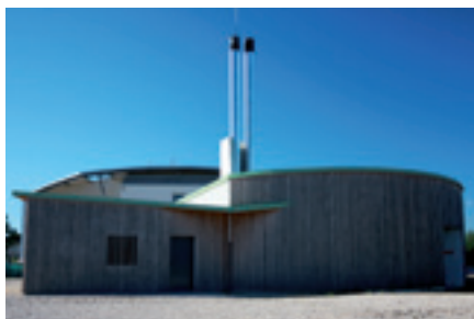
La chaufferie bois a été mise en service en 2008.