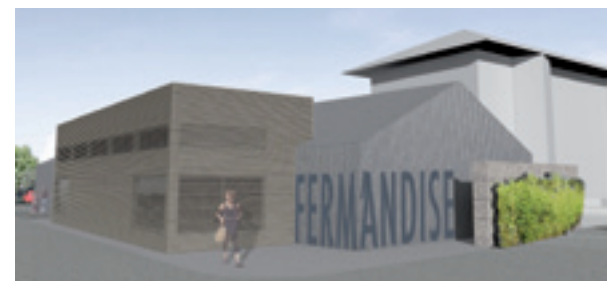
Bourg-en-Bresse Agglomération prend en charge la construction des locaux de Femandises, à Saint-Denis.