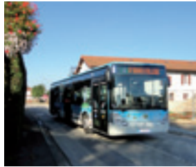
Trois lignes de bus desservent Saint-Denis-lès-Bourg.

• En voiture, à pied, en bus ou en vélo, choisissez le mode de déplacement qui vous convient ! Les travaux de restructuration des voiries (route de Trévoux, Lazaristes, Cالدalles) seront l'occasion de poursuivre le développement d'un réseau de modes doux sur la commune et en direction de Bourg. Ils permettront aussi d'intégrer des places de stationnement complémentaires le long des voies et d'apaiser la circulation.