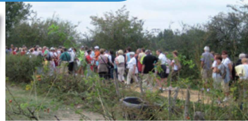
Chaque année, une balade animée, organisée à l'initiative de la commission extra-municipale, invite à découvrir les sentiers de Saint-Denis.

Le PLU est consultable sur le site internet www.stdenislesbourg.fr