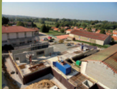
Une ouverture d'école début 2013.

La future école sera ouverte sur son environnement : certains locaux seront à disposition du monde associatif, hors temps scolaire. ●