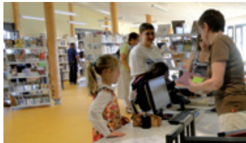
La médiathèque est ouverte du mardi au samedi. Prochain club lecteurs le jeudi 12 janvier, à 20 h.

Depuis son ouverture en mai 2010, la médiathèque a accueilli 706 nouveaux inscrits. Au total, elle compte 1 100 abonnés « actifs », soit un habitant sur cinq, et offre un choix de plus de 11 500 documents (adultes et jeunesse). ●