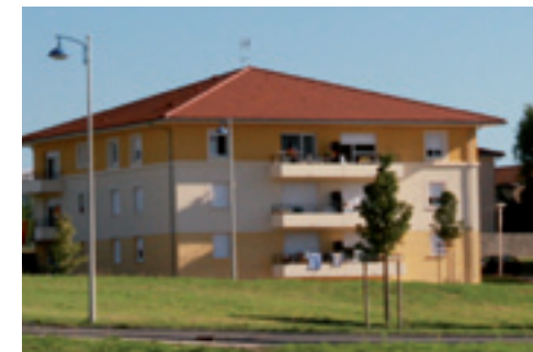
La commune compte 2 500 logements.

3 % en 2003 La loi SRU fixe pour objectif 20 %, avec 20 ans pour y parvenir, de 2000 à 2020.