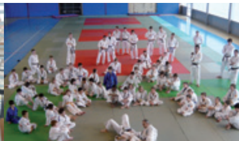
Les équipements sportifs à disposition des associations permettent d'accueillir, au-delà des entraînements locaux, des stages et compétitions internationales, comme l'Open Bresse de judo.