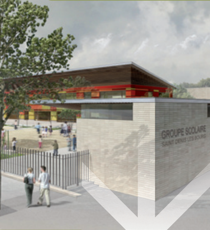
Le futur groupe scolaire du Village.