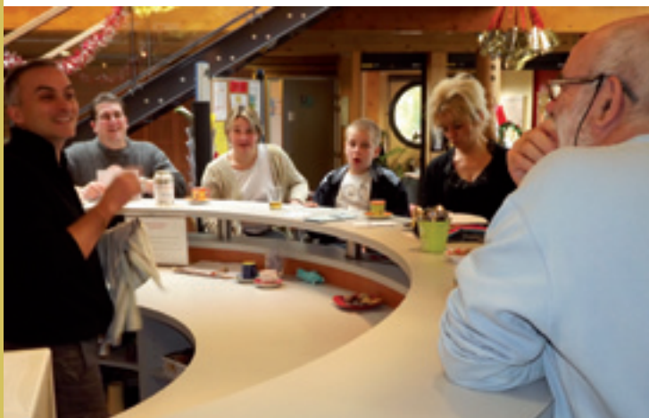
Lieu d'échange convivial, ouvert à tous et animé par des bénévoles, le café habitants du pôle socioculturel est ouvert le mercredi, vendredi et samedi, de 9 h à 12 h 30, et le jeudi de 14 à 17 h.