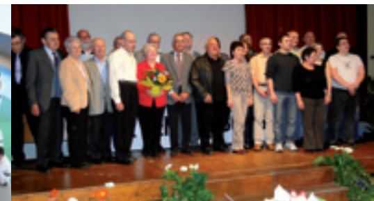
Le 2 avril, la soirée « Merci » organisée par la commission municipale Animation et vie locale a mis à l'honneur 25 bénévoles pour leur engagement dans la vie associative.