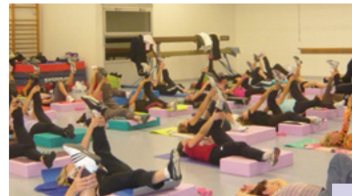
En cours de gymnastique volontaire.

11 associations proposent des activités sportives, réunissant plus de 1 500 adhérents.