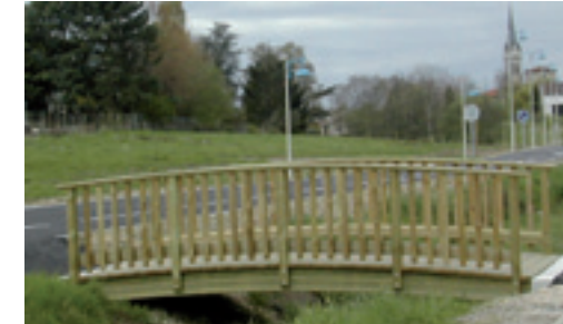
Une passerelle en bois relie la rue Prévert à la voie piétonne et cycliste le long de la Viole.