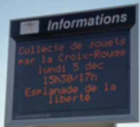
Au centre-village, un panneau lumineux, réactualisé au quotidien, informe en continu sur les services, activités et événements proposés par la commune et les associations.