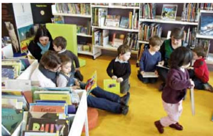
Le 18 mars, dans le cadre de l'opération Premières pages, la médiathèque a accueilli des enfants de Bout'chou et des assistantes maternelles, autour de diverses animations (contes, kamishibai, lectures...).