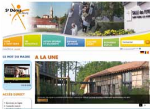
La page d'accueil du nouveau site internet invite à découvrir les actualités locales et donne accès aux diverses rubriques.

Un bulletin municipal relooké et passant si besoin de 4 à 8 pages, un nouveau site internet et un panneau lumineux d'information : la communication de Saint-Denis fait peau neuve, pour vous informer au quotidien.