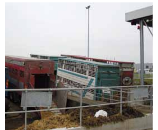
Parmi les services complémentaires développés: la station de lavage des camions.

vers l'Italie, l'Espagne, le Maghreb... » Sur place, le restaurant ouvert le mardi midi accueille jusqu'à 200 convives. « Des visites peuvent s'organiser pendant la foire et le restaurant peut servir des repas sur réservation », ajoute Paul Dresin. Le foirail s'oriente également vers le développement de services complémentaires. Opérationnelle depuis janvier 2010, la station de prétraitement des effluents, financée par Bourg-en-Bresse Agglomération pour un montant de 550 000 €, est équipée de quatre quais pour permettre aux transporteurs de laver leur camion. À l'approche de ses 25 ans, outre la station de lavage, le foirail propose un nouveau service: le suivi des apporteurs d'animaux dès le lundi pour informer les acheteurs de la tendance. Une assurance-garantie de paiement est aussi à l'étude. ●