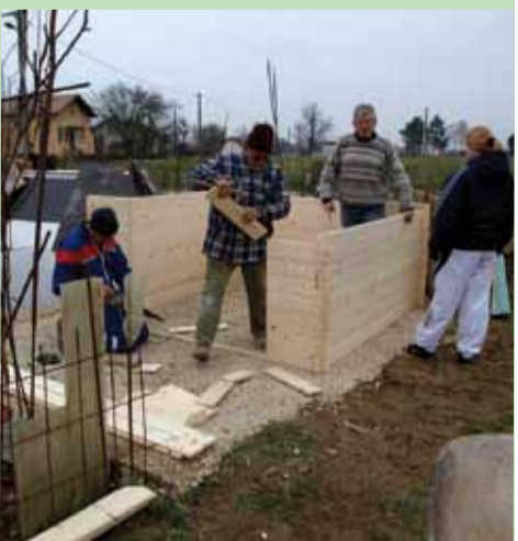
En pleine installation.

L'association dispose également de parcelles à Bourg-en-Bresse, chemin de la Providence, où un projet innovant de jardins familiaux, axé sur le développement durable, est mené en partenariat avec la ville.