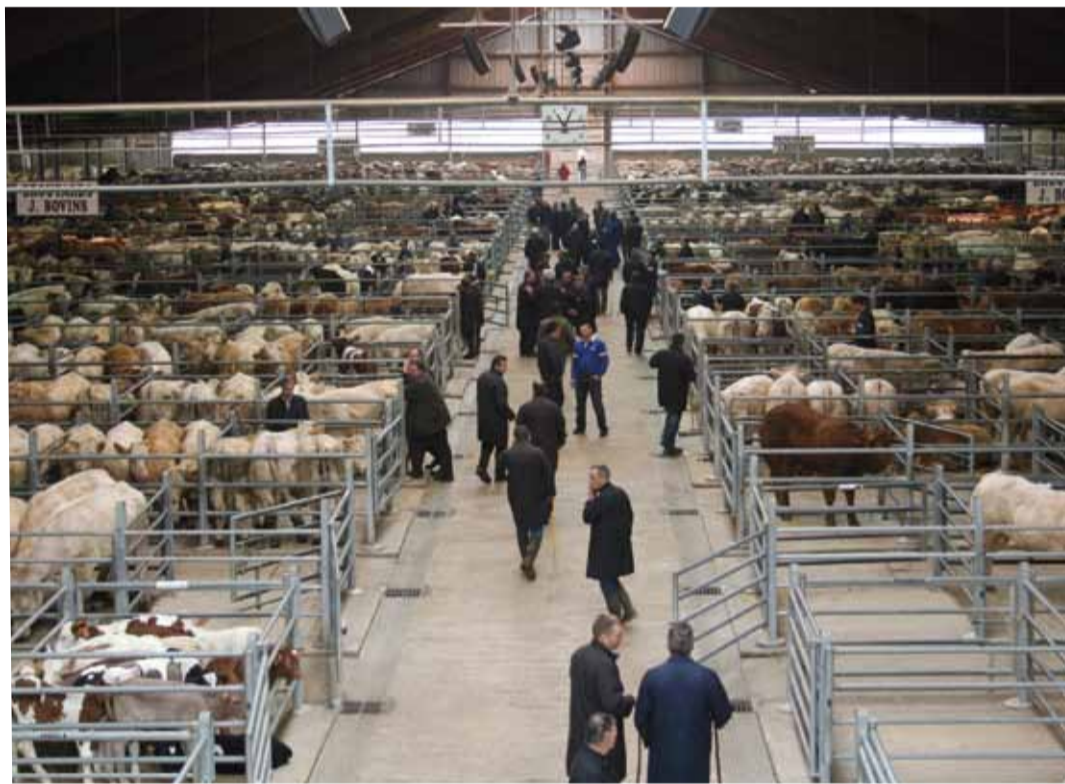
Les 8 300 m 2 du hall accueillent 2 800 animaux en moyenne chaque mardi.

Chaque mardi matin, au 200 rue de la Montbéliarde, les premiers bœufs, brouillards et veaux, parmi les 2800 en moyenne attendus, investissent les 600 cases du foirail de Bourg-en-Bresse. Avec 120 000 têtes de bétail par an, le marché implanté depuis 1986 dans la zone d'activités de la Chambrière à Saint-Denis-lès-Bourg a su se hisser à la première place française. Paul Dresin, vice-président de la