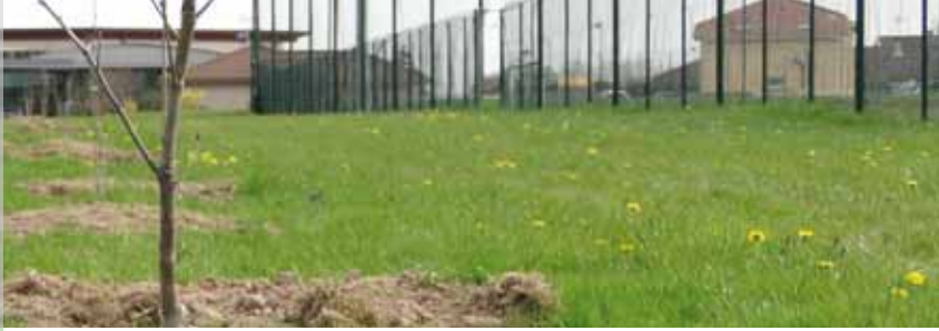
Suite au déboisement pour l'extension du centre d'enfouissement technique des ordures ménagères de la Tienne par Organom, des arbres ont été plantés en mars sur Saint-Denis, chemin des Rippes et derrière le stade de football.