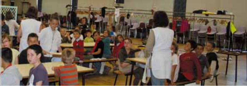
Le restaurant scolaire est géré par l'association Pyramide.