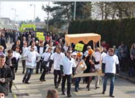
Au défilé 2011.