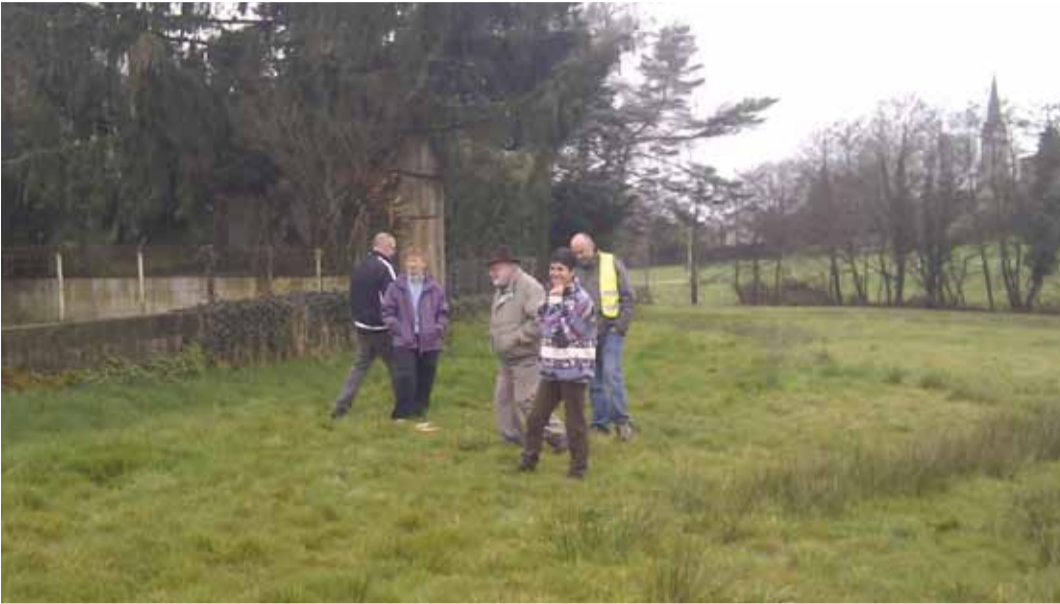
Les élus de la commission environnement à la recherche du meilleur emplacement pour les futurs jardins.

Lancé à l'initiative de la commune, le projet de création de jardins partagés à Saint-Denis croît au rythme des saisons. Depuis décembre, un groupe de travail réunit des élus, des riverains, des associations, le Pôle socioculturel, la Petite unité de vie, le Pôle petite enfance, la maison-relais Tremplin, Pyramide, le comité de fleurissement, le collège... L'association des jardins ouvriers de Bourg-en-Bresse participe à ce comité de pilotage, afin d'apporter son expérience et ses compétences. Des contacts avec d'autres associations gestionnaires de jardins sont en cours.