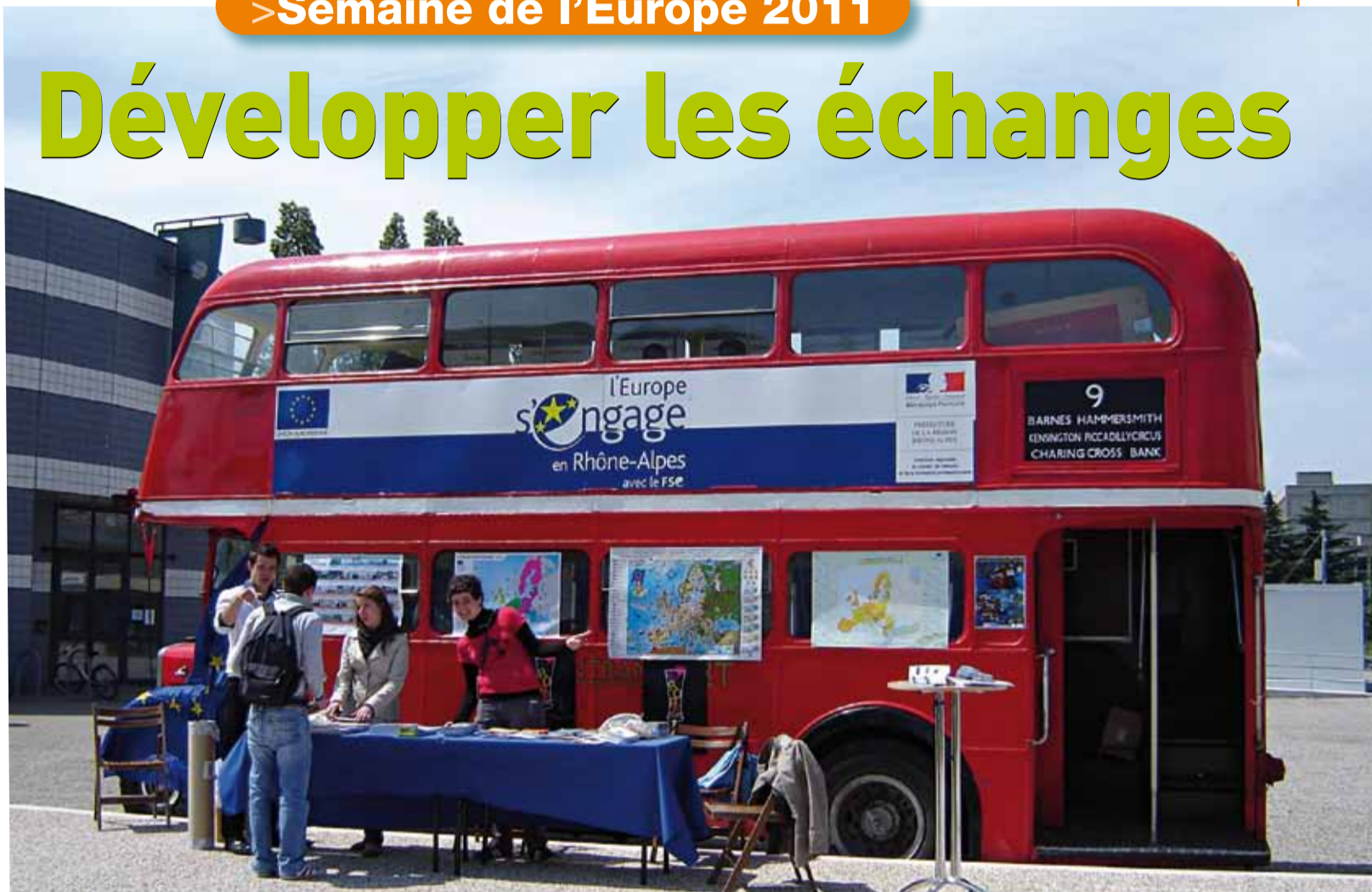
Le Bus de l'Europe stationnera sur le parvis du collège le 10 mai.