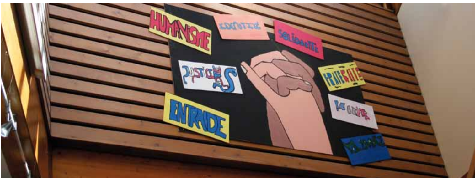
La fresque réalisée par les jeunes de la 3 e session.

Depuis fin février, une nouvelle fresque orne le hall d'entrée du pôle socioculturel. Elle a été réalisée par les jeunes de la 3 e session de l'atelier relais, dispositif de l'Éducation nationale visant à aider les élèves en voie de déscolarisation ou désocialisation, basé au collège de Saint-Denis.