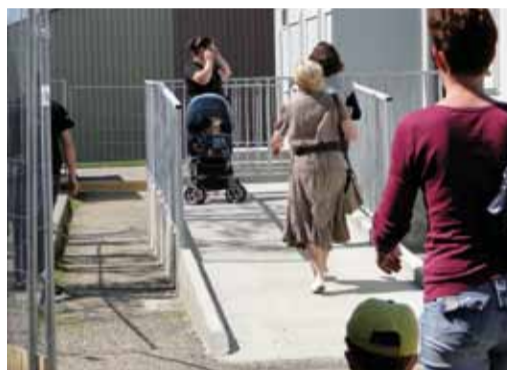
À l'école du Village, une rampe facilite l'accès des personnes à mobilité réduite.

• Conception et édition du journal municipal : le maire a retenu l'offre de la société MG Éditions/Chorégraphique, pour un montant de 15 675 €/an.