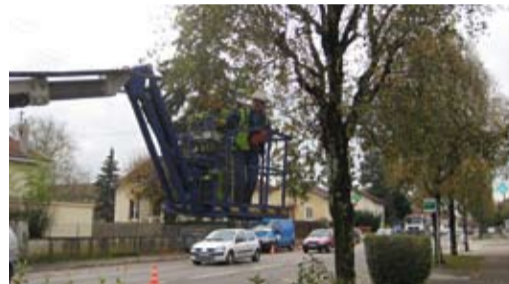
Abattage de bouleaux avenue de Trévoux.