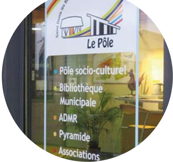
Le Pôle socioculturel réunit divers services et permanences.