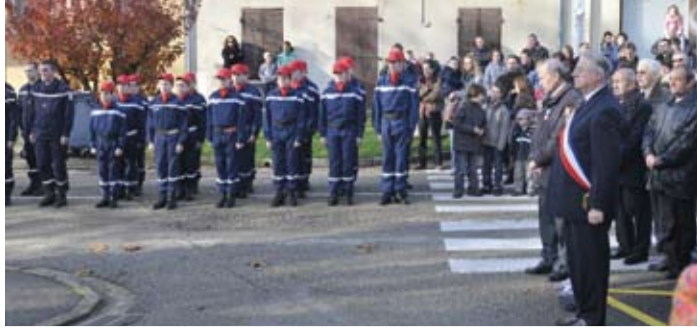
La section intercommunale des Jeunes sapeurs-pompiers (JSP) du collège a participé à la cérémonie du 11 Novembre.

BP 195 ST DENIS LES BOURG 01005 BOURG EN BRESSE CEDEX Tél. 04 74 24 24 64 Fax 04 74 24 35 05 www.ville-saint-denis-les-bourg.fr ville.stdenislesbourg@wanadoo.fr