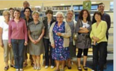
L'équipe de l'Odyssée.