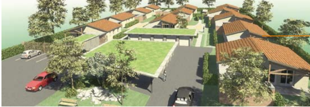
Aux Cadalles, le projet de 14 pavillons labellisés BBC en cours de construction par Logidia.

Familles à énergie positive engagées pour le climat!