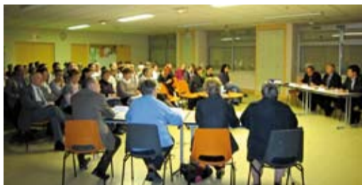
Les acteurs sociaux de Saint-Denis, Péronnas et Viriat étaient conviés à la présentation de l'étude de l'ABS.

Le 21 octobre, plus d'une cinquantaine de personnes ont assisté à la réunion publique de présentation de l'étude de l'analyse des besoins sociaux (ABS) lancée conjointement par les communes de Saint-Denis, Péronnas et Viriat. « Les associations, l'école, les partenaires sociaux, les services municipaux, sont autant