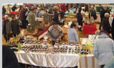
Au marché de la gastronomie 2009.