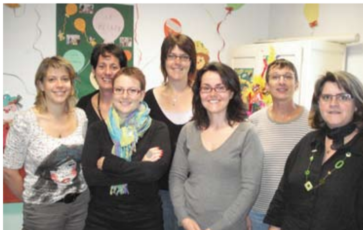
Les animatrices des six relais assistantes maternelles.

Une convention d'entente inter-relais officialise désormais ce réseau. En cours de signature, elle définit le rythme des rencontres (toutes les 6 semaines) et les objectifs : développer des liens pour apporter des réponses cohérentes au public utilisateur des relais, favoriser la professionnalisation, organiser des actions de parentalité... Un pré-projet de l'activité, avec budget prévisionnel, sera présenté chaque année aux gestionnaires et financeurs, mi-septembre. ●