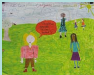
Une des affiches réalisées pour la Journée internationale des droits de l'enfant.