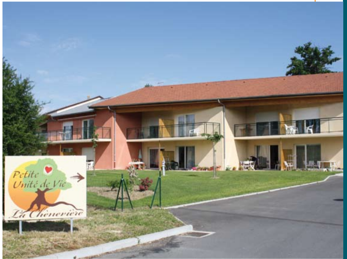
La construction de la petite unité de vie (PUV) par Bourg Habitat a traduit la volonté de logements diversifiés.

Du point de vue des sociétés de construction et de gestion, Saint-Denis-lès-Bourg connaît une forte demande de logements, en raison de ses multiples avantages: une petite ville dynamique, dotée de nombreux services, alliée au charme de la campagne. Pour favoriser la mixité, plusieurs produits sont proposés: l'habitat locatif aidé individuel ou collectif, l'accession aidée à la propriété et le lotissement.