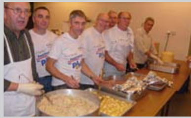
45 bénévoles ont servi 265 choucroutes pour le Téléthon 2009.