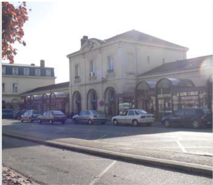
L'aménagement de la gare de Bourg-en-Bresse en pôle multimodal a pour objectif de faciliter et de sécuriser son accès.

l'ouverture de la gare côté rue du Peloux, sous la maîtrise d'ouvrage RFF. La seconde, sous la maîtrise d'ouvrage des collectivités locales, a trait à la réalisation des aménagements, gare routière et garages à vélos, avenue Pierre Sépard. Le tout dans un délai d'un an à un an et demi. La troisième phase concerne les équipements à l'intérieur de la gare : création d'ascenseurs pour les personnes à mobilité réduite, rehaussement partiel des quais, création d'une station d'arrêt de bus et d'autocars, de rampes pour