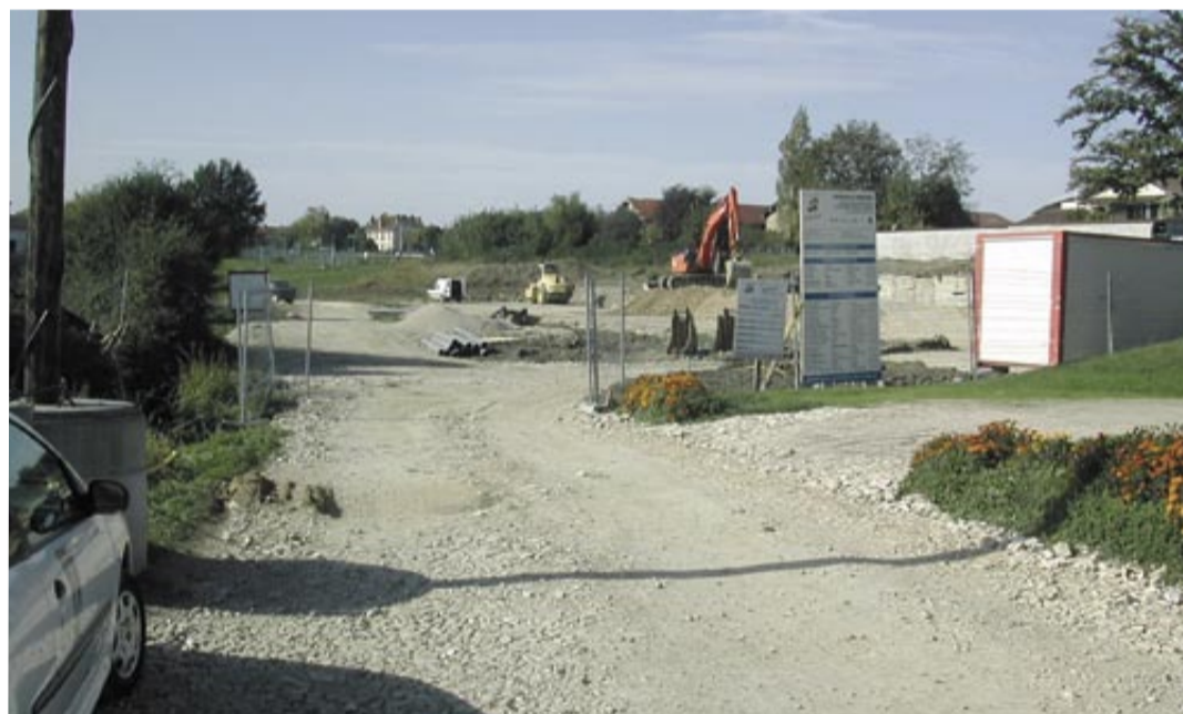
Au début des travaux.

Après avoir validé le schéma des voiries et réseaux de desserte du site de La Viole, permettant d'intégrer la PUV (Petite unité de vie), 22 logements locatifs et le pôle socio-culturel, le conseil municipal a examiné l'estimation financière des travaux, chiffrée par le maître d'œuvre, Projet Action 2000.