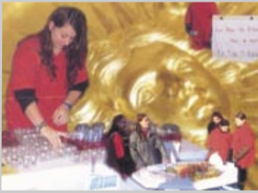
Les bénévoles ont tenu le stand.

• les bougies de Modern'Jazz La section « modern'jazz » de l'ACS a animé deux stands de vente de bougies, l'un au centre commercial du village, l'autre au marché. L'excellente ambiance et la mobilisation de chacun ont permis la belle réussite de cette opération. Les bénéficiaires financeront la sortie au spectacle « Le roi soleil » à Lyon le 21 avril .