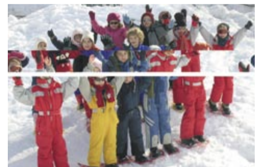
Le ski est au programme en février.

Les Mousquetaires de la Chanson donneront un concert le dimanche 18 février à 14 h 30 , à la salle des fêtes, au profit de l'ACIM (les Amis d'un coin de l'Inde et du monde). Tous les bénéficiaires seront versés à Shantivanam, petit village situé au Sud-Est de l'Inde pour soutenir ses projets de développement alimentaires, sanitaires, éducatifs et de logement. 12 € pour les adultes et 7 € pour les enfants. Réservation : à partir du 15 janvier au 04 74 21 98 34 ou 04 74 24 25 84 ou 04 74 24 20 81 . ●