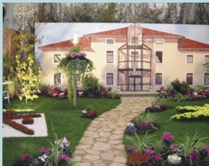
Le stand de Saint-Denis.

Entente très cordiale et collaboration très efficace entre le comité de fleurissement et les services techniques de la commune pour concevoir, mettre en place et peaufiner le stand de Saint-Denis aux Florales qui se tenait à Ainterexpo.