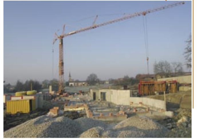
Les travaux sont en cours.

Nous avons voulu qu'elle soit dans le village. Il y aura de la vie et les résidents auront accès à tous les services. Deux ensembles de 11 logements locatifs seront construits à proximité par Bourg Habitat. Cet aménagement voisin favorisera la mixité inter âge.