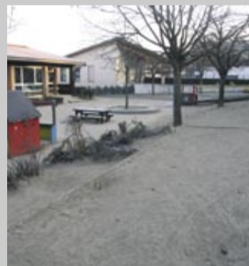
À la rentrée 2007, la cour devrait avoir une nouvelle allure.

Le réaménagement de la cour de l'école maternelle du village, réclamé depuis plusieurs mois par le conseil d'école, les enseignants, les parents et les élus, a fait l'objet de deux esquisses remises par l'architecte paysagiste Willem Den Hengst. Le conseil municipal, sur proposition du maire et de Maurice Béraudier, a jugé utile de poursuivre les études pour une réalisation au cours de l'été 2007.