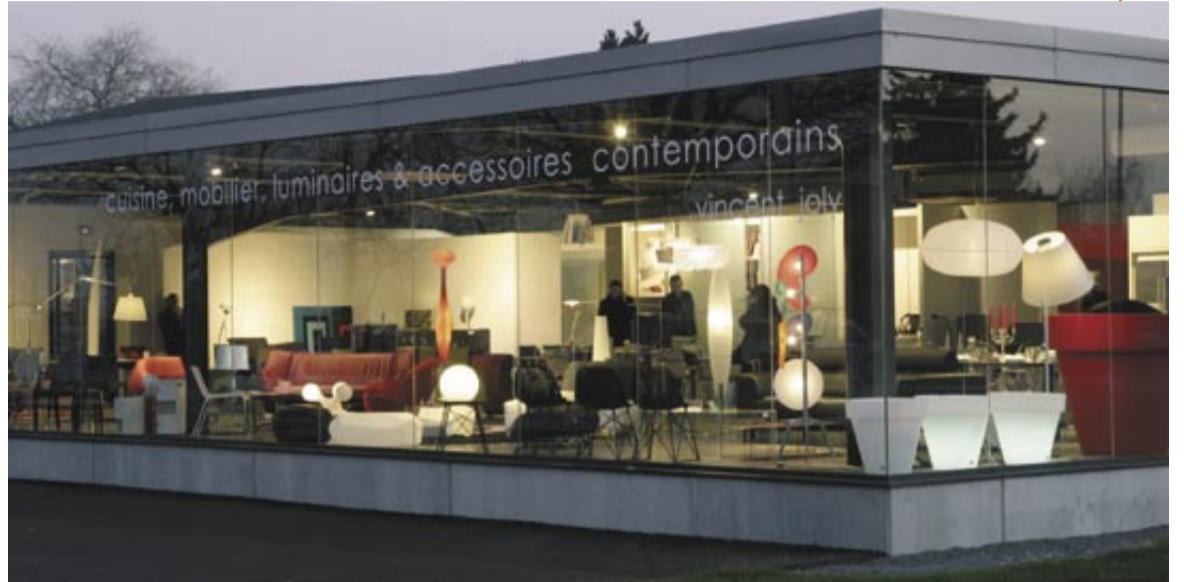
Une nouvelle vitrine, chemin des Lazaristes.