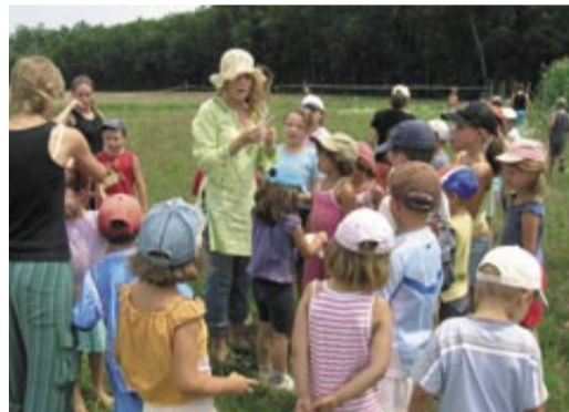
La CAF soutient les actions pour l'enfance.

Par ailleurs, le conseil municipal a décidé de proroger jusqu'au 30 juin 2007 la convention de gestion du dispositif enfance jeunesse passée avec l'association Pyramide. Ce délai permettra de bien caler les actions nouvelles à développer.