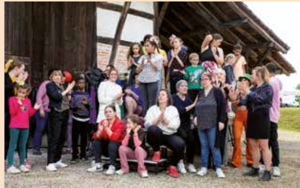
Y'a foule – projet intergénérationnel