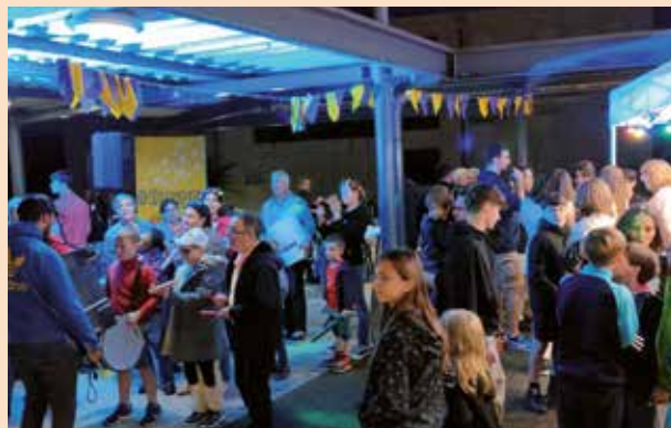
Festival Summer #2024