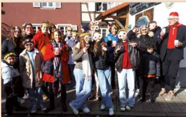
Séjour à Schutterwald – jeunes et familles