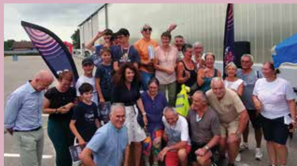
Un rallye, un podium et des spectacles ont rythmé la journée de clôture de Terre de Jeux 2024